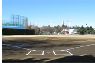
大銀杏 (おおいちよう) 球場 ※少年野球・ソフトボール専用