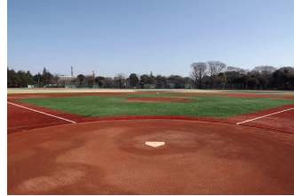
コブシ球場 (人工芝) ※少年野球・ソフトボール専用